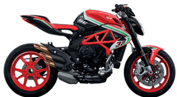
ROSSO MAMBA/NERO CARBON METALLIZZATO/ BIANCO PERLATO RC/VERDE