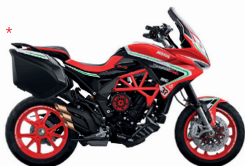
ROSSO MAMBA/NERO CARBON METALLIZZATO/ BIANCO PERLATO RC/VERDE